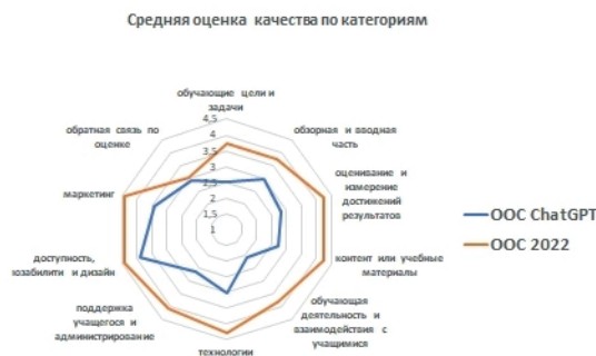
Рис. 1. Распределение результатов критериальной оценки качества электронных курсов, созданных ИИ, и среднего уровня, по результатам оценки более 200 электронных курсов, созданных авторскими коллективами 1